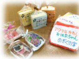
廃油石鹸や たわし、ハ ンドメイド 雑貨