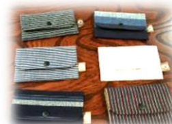
亀田綺を 使った各商 品