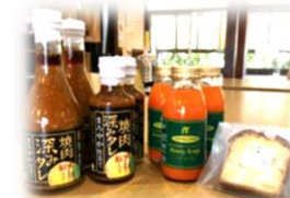
和梨のパウ ンドケーキ や梨入り焼 き肉のタレ