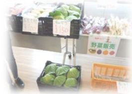
採れたて新 鮮野菜等